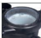
Przezroczysta pokrywa filtra wstępnego