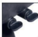
Korek spustowy na zimę