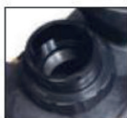
Łatwa w obsłudze konstrukcja